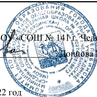
График работы школьного инспектора на 2022 год